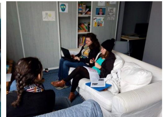
Le groupe stratégique réfléchit dans les canaps' de l'école démocratique.