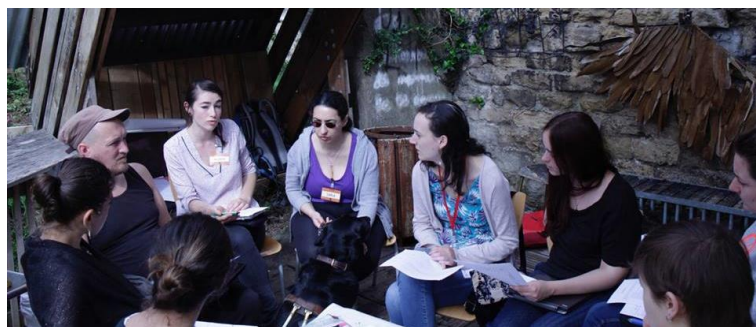
L'assemblée générale a eu lieu dans le petit jardin de l'école ☺

Ritimo a fait un appel à ses membres pour renforcer le Conseil d'Administration. Le réseau Ritimo pourrait enrichir les pratiques de dynamique réseau et ressources de Sens. Suite à la décision de l'Assemblée générale, l'animatrice de réseau se présentera début juin pour faire partie du CA de Ritimo.